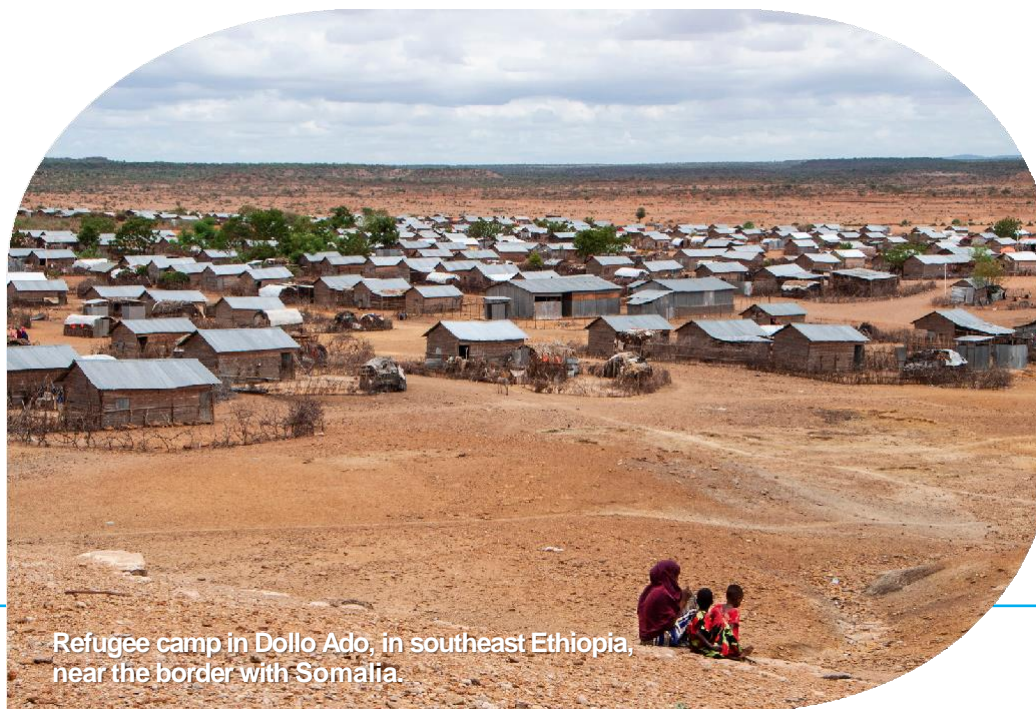
Refugee camp in Dollo Ado, in southeast Ethiopia, near the border with Somalia.

DZIĘKUJEMY ZA TWOJĄ MODLITWĘ PROSIMY, NADAL STÓJCIE PO STRONIE NASZYCH PRZYMUSOWO WYSIEDLONYCH PRZYJACIÓŁ: WWW.JRS.CENTER