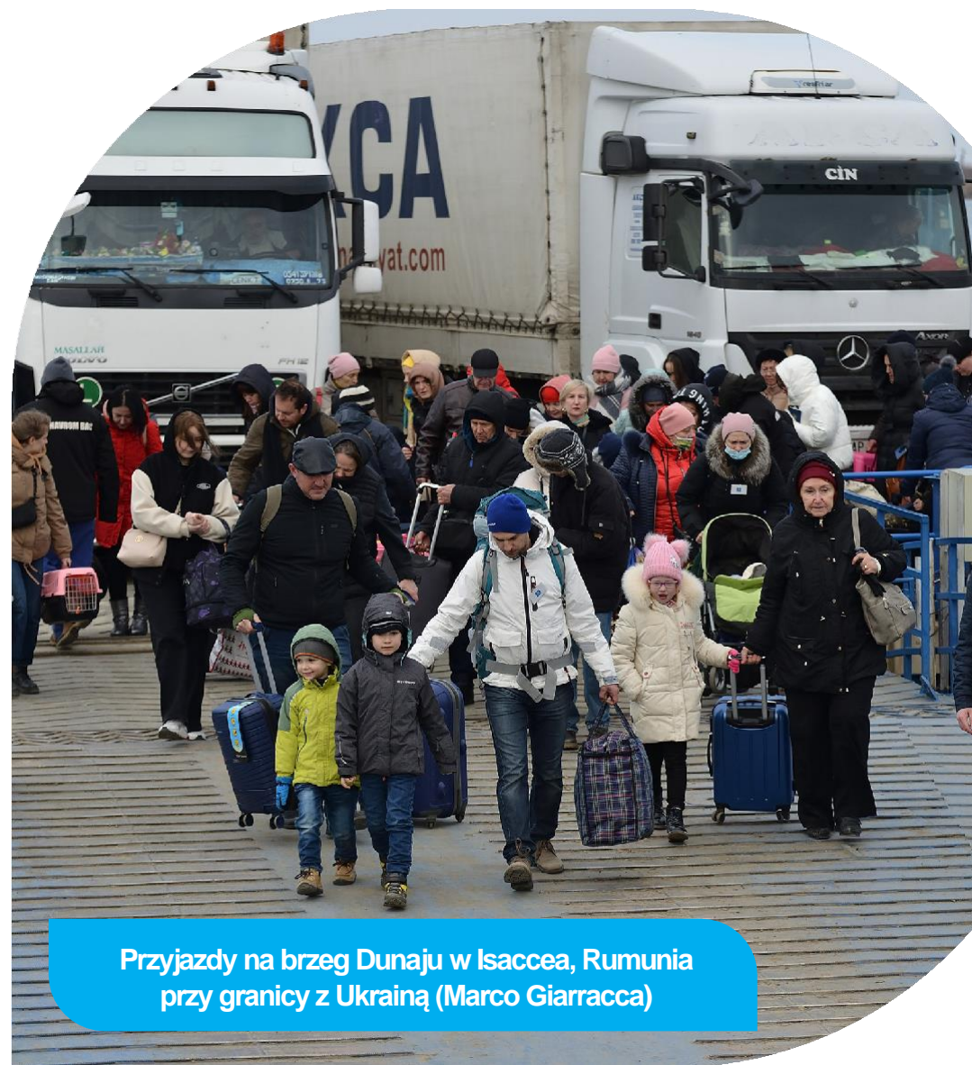
Przyjazdy na brzeg Dunaju w Isaccea, Rumunia przy granicy z Ukrainą (Marco Giarracca)

Ponieważ konflikt trwa nadal, z niszczycielskimi konsekwencjami dla ludności, JRS i jezuici nadal są obecni i mobilizują zasoby, aby wspierać najbardziej poszkodowanych. Wraz z Xavier Network koordynujemy wdrażanie One Proposal, ustrukturyzowanego planu przyjęcia, ochrony, wsparcia i integracji Ukraińców przymusowo przesiedlonych w całej Europie.